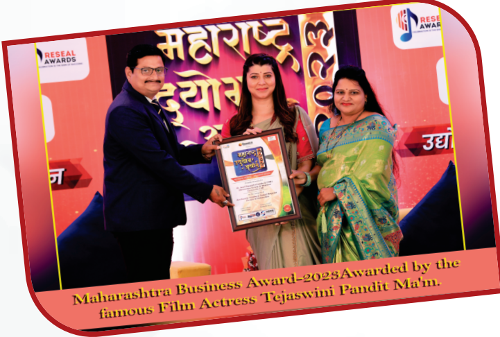
Maharashtra Business Award-2023 Awarded by the famous Film Actress Tejaswini Pandit Ma'm.